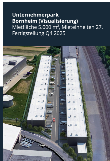
Unternehmerpark Bornheim (Visualisierung) Mietfläche 5.000 m 2 , Mieteinheiten 27, Fertigstellung Q4 2025

Metroloq ist stets auf der Suche nach attraktiven Grundstücken und Bestandsimmobilien zur Weiterentwicklung und Erweiterung unseres Portfolios. Dabei bevorzugen wir Standorte, die sich durch eine gute Anbindung und nachhaltige Nutzungspotentiale auszeichnen. Die Zielgröße der Grundstücke reicht von 8.000 bis 30.000 m 2 , wobei wir sowohl bestehende Objekte als auch Neubaupotentiale in Betracht ziehen. Wir freuen uns darauf, in der Metropolregion Rhein-Ruhr moderne und nachhaltige Unternehmerparks zu entwickeln, die lokalen und regionalen Unternehmen Raum für Wachstum bieten.