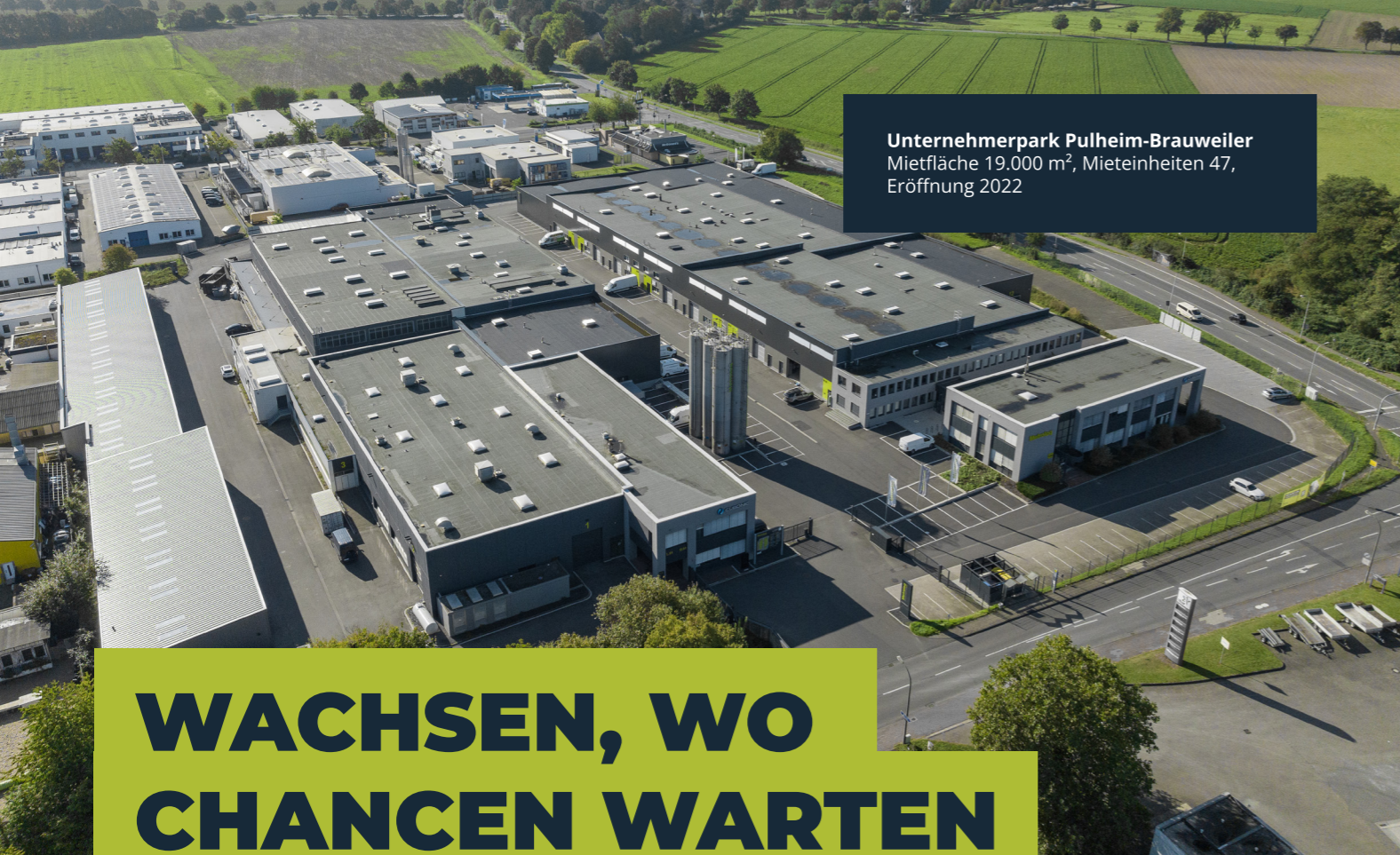
Unternehmerpark Pulheim-Brauweiler Mietfläche 19.000 m 2 , Mieteinheiten 47, Eröffnung 2022