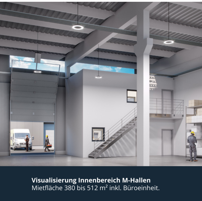
Visualisierung Innenbereich M-Hallen Mietfläche 380 bis 512 m 2 inkl. Büroeinheit.

Metroloq ist ein langfristig engagierter Bestandshalter und bietet moderne Mietflächen für lokale und regionale, kleine und mittelständische Unternehmen. Unsere Unternehmerparks sind flexibel nutzbar und passen sich den Bedürfnissen wachsender Unternehmen an.